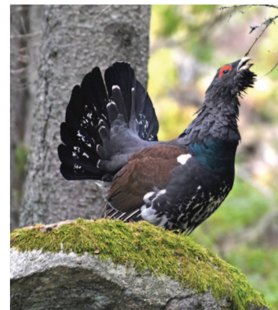
Metso yritti häätää leiriläiset pois ”omasta metsästään” kesällä 2019.